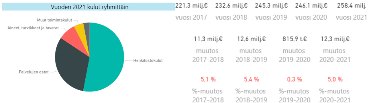
Kuva: Soiten ulkoiset kulut ryhmittäin 1-9/2021 sekä ulkoisten kustannusten muutos kausilta 1-9 /2017 - 9/2021