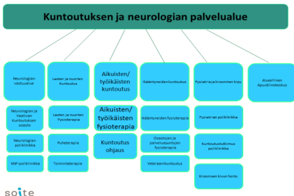
Taulukko: Kuntoutuksen ja neurologian palvelualue Soitessa

Vuonna 2019 kuntoutuspalveluihin tuli toiminta- ja työkykyarvioita varten läheteet 71:stä potilaasta, joista 36 tuli oman sairaalan joltain erikoisalalta ja terveyskeskuksesta 28 kpl.